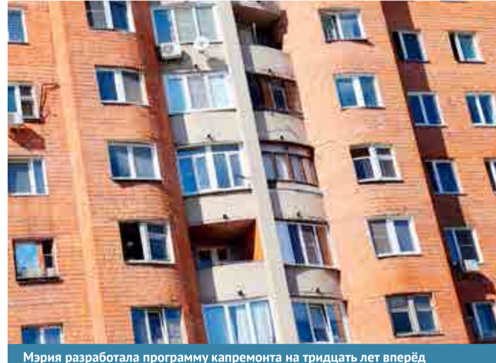
Мэрия разработала программу капремонта на тридцать лет вперед

С февраля 2015 года сбор средств на капитальный ремонт многоквартирных