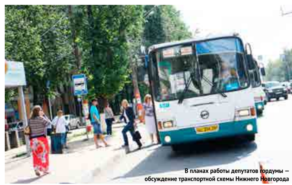
В планах работы депутатов гордумы — обсуждение транспортной схемы Нижнего Новгорода

Красной нитью на заседаниях комиссии по транспорту и связи в последние годы проходит вопрос о разработке новой транспортной схе-