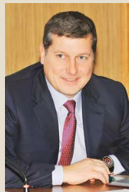
Олег СОРОКИН, глава Нижнего Новгорода

— Сейчас мы думаем над тем, какие следующие городские программы должны появиться для реализации. Потому что я твёрдо уверен в том, что как раз депутатский корпус на уровне муниципалитета должен быть проводником этих программ, стражем преемственности их реализации, вне зависимости от того, кто в данный момент руководит городом. Нужно знать и понимать, что эти программы нужны населению, иначе это будет просто пустая трата средств.