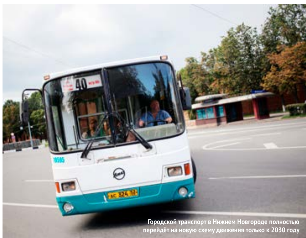
Городской транспорт в Нижнем Новгороде полностью перейдёт на новую схему движения только к 2030 году